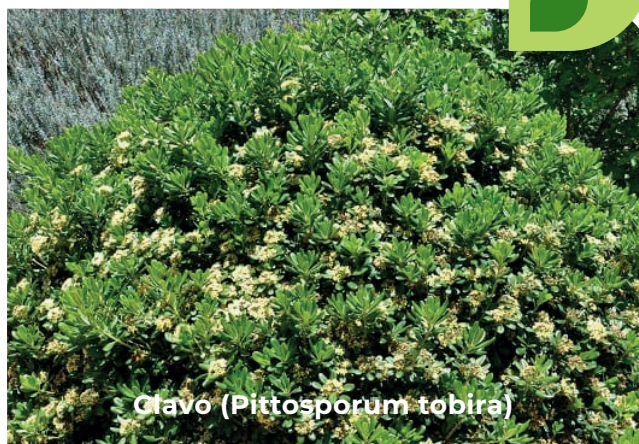
Clavo ( Pittosporum tobira )