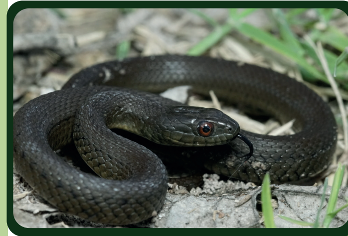
Culebra de agua de panza negra ( Thamnophis melanogaster )